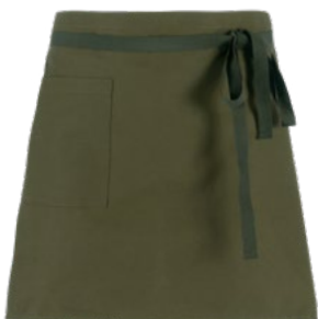
Z43 Military green