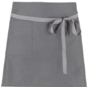
C02 Light grey