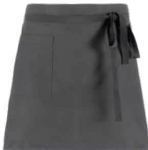
M12 Grigio medio