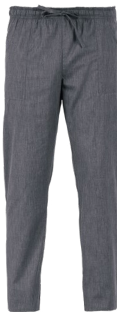
119 Grigio medio